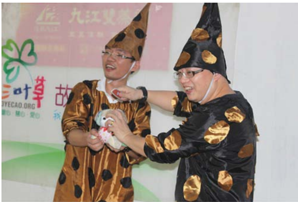
还有这个，大家都熟悉的