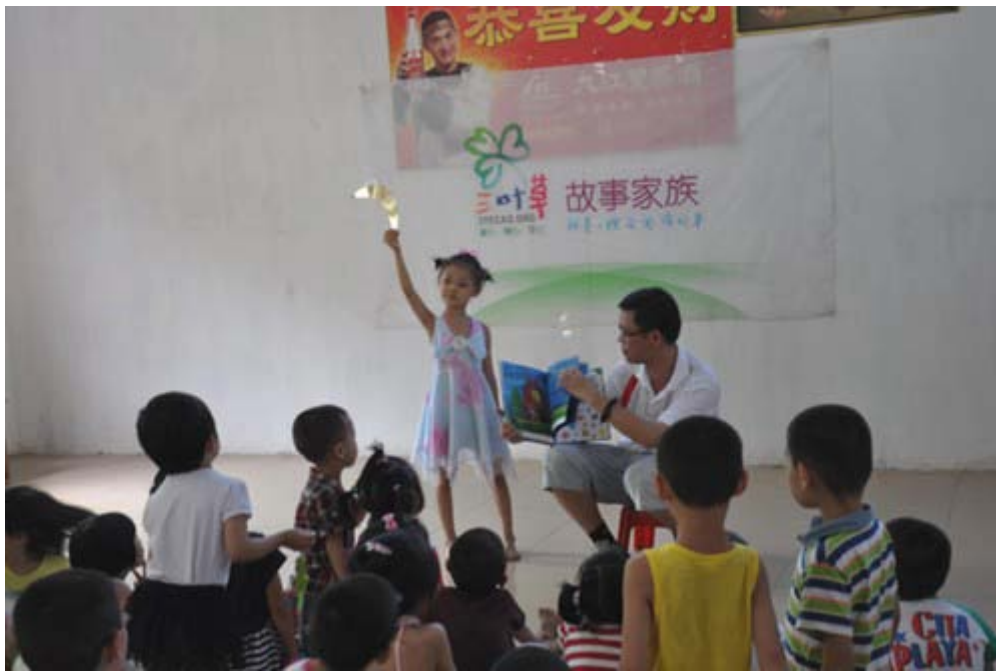
爸爸，我想要月亮的讲述现场