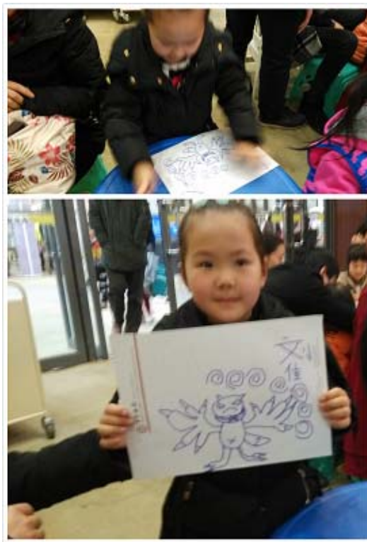
大家看看，我画得不错吧！